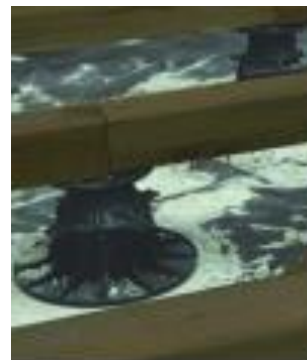
Figuur 2: Vloerdrager (3)

Wanneer het terras geplaatst zal worden op een oneven zand/gras ondergrond kan er gebruik gemaakt worden van de Cobra ® Funderingsschroef of piketpaaltjes (3).