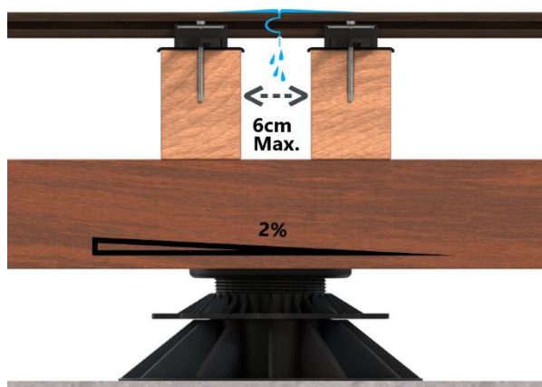
Figuur 3: Dubbele onderconstructie met dubbele onderbalk bij de uiteindes van de terrasplanken. Plaats de balken niet verder dan 6cm uit elkaar.